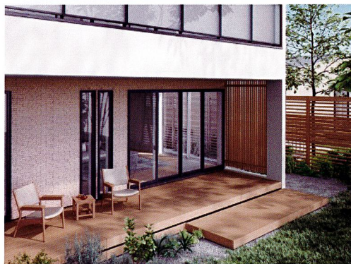
樹ら楽 プレーンタイプ