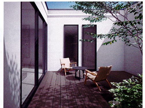
樹ら楽 木彫タイプ